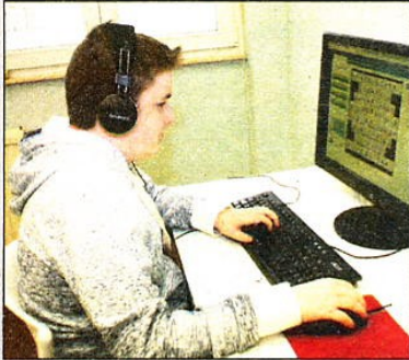
De nieuwe school De Lift is gestart met vier leerlingen.

DIEST - In de oude gebouwen van de para's op de citadel in Diest is maandag 'De Lift' gestart, een nieuwe school voor normaal begaafde kinderen, maar wel met een zware vorm van autisme. Met de helft van de lessen gewijd aan informatica, bereidt de school vooral voor op een job in de IT-sector. Er zitten nu vier leerlingen, die individueel gerichte begeleiding krijgen.